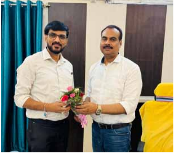
नई सोच एक्सप्रेस

उपलब्ध कराना तथा सरकार के राजस्व हितों की प्रभावी सुरक्षा