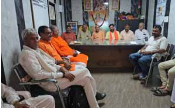
गणमान्य लोगों के साथ बैठक की और आरोपी को सबसे सजा देने की मांग की। योगी समाज की मांग है कि यह केस फास्ट ट्रैक अदालत में चले और जल्द से जल्द आरोपी को फांसी की सजा होनी चाहिए! ताकि इस प्रकार का गिनोना काम आगे कोई ना करे। वहीं उन्होंने उत्तर प्रदेश सरकार से भी मांग की है कि पीडित परिवार को आर्थिक सहायता दी जाए क्योंकि वह काफी गरीब परिवार है और आरोपी के घर के ऊपर बुलडोजर चलाकर

कुरुक्षेत्र। हरियाणा के कुरुक्षेत्र में जोगी के बाद समाज के मुख्य कार्यालय में हरियाणा से आए सभी जोगी समाज के लोगों ने उत्तर प्रदेश के बागपत जिले में 3 वर्षीय बच्ची के साथ रेप की घटना पर लिया फ्रैसला! घटना के बाद हरियाणा जोगी समाज में रोष, आरोपी को फांसी की सजा की की मांग, देश में छोटी बच्चियों के साथ रेप की घटनाएं बढ़ती जा रही है ऐसे ही घटना एक उत्तर प्रदेश के बागपत जिले में सामने आई है जब 3 साल की बच्ची के साथ एक आरोपी के द्वारा रेप की घटना को अंजाम दिया गया है। हालांकि पुलिस के द्वारा आरोपी को गिरफ्तार कर दिया गया है लेकिन इस घटना के बाद हरियाणा में जोगी समाज में कॉपी रोष देखने को मिल रहा है। क्योंकि वह उनके समाज की बेटी है ऐसे में उन्होंने कुरुक्षेत्र धर्मशाला में जोगी समाज के पदाधिकारी और