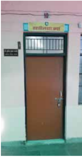
कारण बताकर निरस्त कर दिया जाता है। ऐसा ही एक मामला ग्राम सोमही के एक किसान का सामने आया है। किसान ने शासन द्वारा संचालित नाम

गोरखपुर। बांसगांव तहसील में भ्रष्टाचार और धनउगाही के आरोप लगातार चर्चा का विषय बने हुए हैं। क्षेत्रीय लोगों का आरोप है कि तहसील के विभिन्न कार्यालयों में बिना सुविधा शुल्क दिए सामान्य एवं वैधानिक कार्य भी समय से नहीं हो रहे हैं। इससे किसानों और आम नागरिकों को भारी परेशानियों का सामना करना पड़ रहा है। विवसनीय सूत्रों के अनुसार, रजिस्ट्रार कानूनगो कार्यालय में तैनात कुछ कर्मचारियों, भूलेख कंयूटर ऑपरेटर, कृषि पटल तथा आम राजस्व कर्मियों पर विभिन्न ऑनलाइन एवं ऑफलाइन आवेदनों के निस्तारण के नाम पर अवैध धन उगाही के आरोप लग रहे हैं। आरोप है कि सुविधा शुल्क नहीं मिलने पर आवेदनों को अनावश्यक रूप से लंबित रखा जाता है या तकनीकी