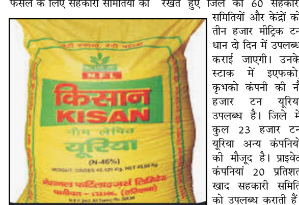
तीन हजार मीट्रिक टन यूरिया खाद की परेशानी नहीं होगी। इस मामले में शीघ्र मुहैया कराई जाएगी। एआर फले से तैयारी शुरू कर गई है।