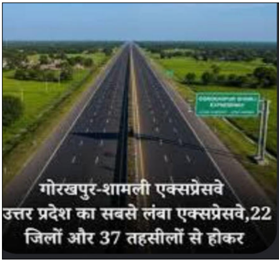
गोरखपुर-शामली एक्सप्रेसवे उत्तर प्रदेश का सबसे लंबा एक्सप्रेसवे, 22 जिलों और 37 तहसीलों से होकर

गांव आलमगीरपुर, आराजी गहजेडा, असलेमपुर, बहादुरनगर, बहादुरपुर गज्जू, बोबधवाला, फौलादपुर, गजहेडा आलम, गजहेडा सैद, गामरी, इनायतनगर, खाईखेड़ा, ख्वाजापुर घंटला, किशनपुर गामरी, लालपुर पीपलसाना, लौंगीकला, मधुपुरी, निर्मलपुर, पाडला, पैसियापुरा पदार्थ, रघुनाथपुर, सरकारा परम्पुर माफी, शेरपुर बाहलीन, शेरपुर पट्टी, शिवनगर शामिल हैं। एक्सप्रेसवे वे बिजनौर जिले के धामपुर से कांठ के दो गांवों से होते हुए सड़क क्षेत्र के आठ गांवों से गुजरेगा। इसके बाद टाकुरद्वारा के 25 गांवों से होते हुए रामपुर जिले के विकास खंड टांडा, बिलासपुर, स्वार से होकर बरेली के लिए निकलेगा। सरकारी, गैर सरकारी जमीनों के अलावा पेड़ों, विद्युत खंभों, कुओं, नदी, तालाब की भी जानकारी इकट्ठा की जा रही है।