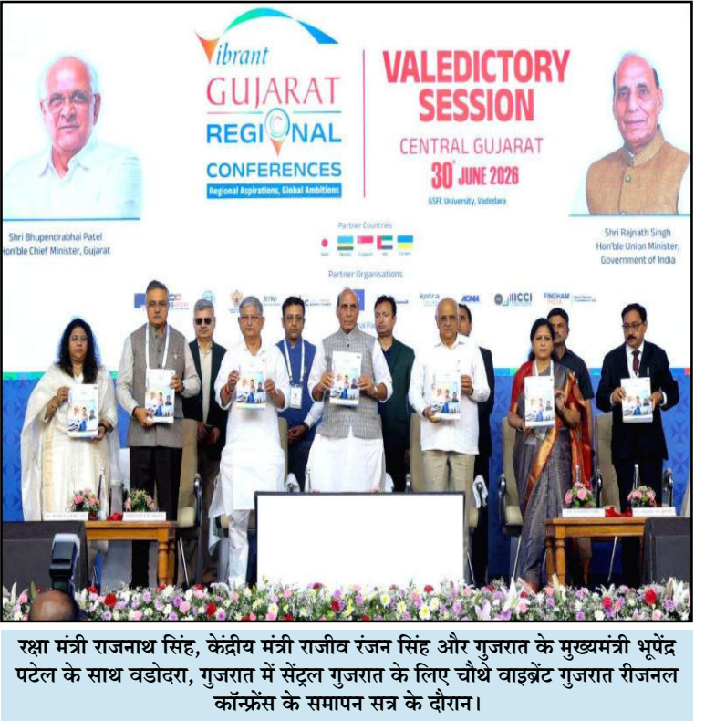
रक्षा मंत्री राजनाथ सिंह, केंद्रीय मंत्री राजीव रंजन सिंह और गुजरात के मुख्यमंत्री भूपेंद्र पटेल के साथ वडोदरा, गुजरात में सेंट्रल गुजरात के लिए चोथे वाइब्रेंट गुजरात रीजनल कॉन्फ्रेंस के समापन सत्र के दौरान।

क्या है पूरा मामला और हाईकोर्ट का फैसला ? आपको बता दें कि साल 2013 में दो नाबालिगों के साथ रेप के हाई-प्रोफाइल मामले में आसाराम को दोषी ठहराया गया था। इसी साल मई के महीने में राजस्थान हाईकोर्ट ने अपना फैसला सुनाते हुए सह-आरोपियों को बरी कर दिया था।