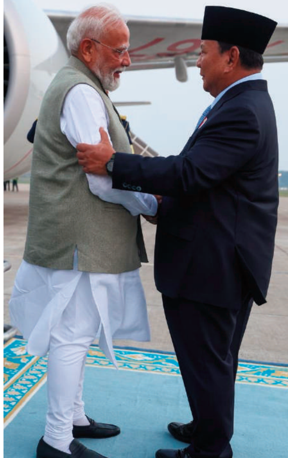
प्रधानमंत्री मोदी राजकीय यात्रा पर जकार्ता पहुंचे हैं। आगमन पर हवाई