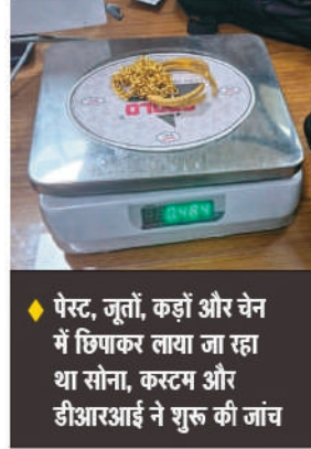
पेस्ट, जूतों, कढ़ाई और चैन में छिपाकर लाया जा रहा था सोना, कस्टम और डीआरआई ने शुक्र की जांच

अमृतसर के श्री गुरु रामदास जी अंतरराष्ट्रीय एयरपोर्ट पर कस्टम विभाग और राजस्व खुफिया निदेशालय (डीआरआई) ने महिला समेत तीन यात्रियों से 1 करोड़ रुपये से अधिक कीमत का सोना बरामद किया है। यह यात्री सोने को पेस्ट, जूतों, कढ़ाई और चैन के रूप में छिपाकर भारत लाने की कोशिश कर रहे थे।