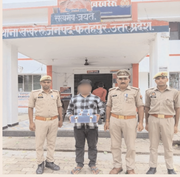
पूछताछ के दौरान अभियुक्त ने बताया कि वह वर Dollar

सबसे तेज प्रयागराज फतेहपुर। खखरेरु पुलिस द्वारा बड़ी कार्रवाई करते हुए साइबर फ्राड एवं धोखाधड़ी कर वर डॉलर को भारतीय रुपए में बदलने व कूट रचित दस्तावेज तैयार कर देश के अलग अलग हिस्सों में रहने वाली आम जनता को ट्रेडिंग के नाम पर छलकर उनके पैसों को अपने खातों में जमा कराने वाले अभियुक्त को गिरफ्तार किया गया। गिरफ्तार अभियुक्तों के कब्जे से लैपटॉप, मोबाइल फोन, विभिन्न बैंकों के एटीएम कार्ड, बैंक ऑफ बड़ौदा की पासबुक तथा अलग-अलग जन्मतिथि अंकित पैन कार्ड की छायाप्रतियां बरामद की गईं। फतेहपुर पुलिस अधीक्षक