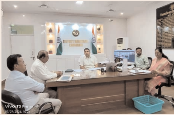
कल्याण मंडपम के निर्माण कार्य की प्रगति की समीक्षा के दौरान आवश्यक निर्देश दिए। उन्होंने सभी अधिशासी अधिकारियों से कहा कि अपने-अपने नगर

जिलाधिकारी ने नगर पालिका परिषद, मंझनपुर के अंतर्गत निर्माणधीन कान्हा गौशाला एवं