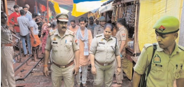
पुलिस अधिकारियों एवं कर्मचारियों को आवश्यक दिशा-निर्देश दिए। उन्होंने श्रद्धालुओं की सुरक्षा, सुगम आवागमन, यातायात प्रबंधन, भीड़ नियंत्रण, महिला सुरक्षा तथा अपातकालीन परिस्थितियों से प्रभावी ढंग से निपटने के लिए

निरीक्षण के दौरान उन्होंने मेला परिसर, मंदिर क्षेत्र, घाटों, प्रमुख मार्गों, बैरिकेडिंग, पार्किंग स्थल, खोया-पाया केन्द्र, कंट्रोल रूम तथा अन्य महत्वपूर्ण स्थानों का जायजा लेते हुए ड्यूटी पर तैनात