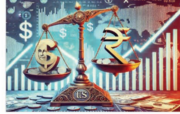
मुकाबले अमेरिकी डॉलर की स्थिति को दिखाने वाला डॉलर सूचकांक 0.10 फीसदी की बढ़त के साथ 100.95 पर रहा।

अमेरिकी डॉलर के मुकाबले सोमवार को भारतीय रुपया 24 पैसे की गिरावट के साथ ही 95.42 पर बंद हुआ। इससे पहले आज सुबह रुपया शुरुआती कारोबार में 10 पैसे की गिरावट के साथ ही अमेरिकी डॉलर के मुकाबले 95.28 पर आ गया। विदेशी बाजार में अमेरिकी मुद्रा के मजबूत होने से रुपये पर दबाव है। विदेशी मुद्रा कारोबारियों ने बताया कि विदेशी निवेश आने पर भारतीय रिजर्व बैंक (आरबीआई) इस बीच, छह प्रमुख मुद्राओं के