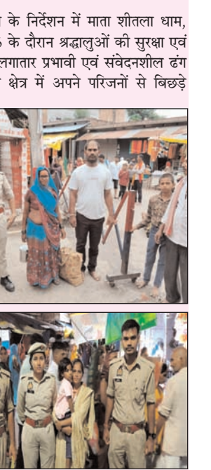
शीतला धाम: मेला में बिछड़े 20 से अधिक श्रद्धालुओं एवं बच्चों को परिजनों से सकुशल मिलाया, धन्यवाद कौशांबी पुलिस