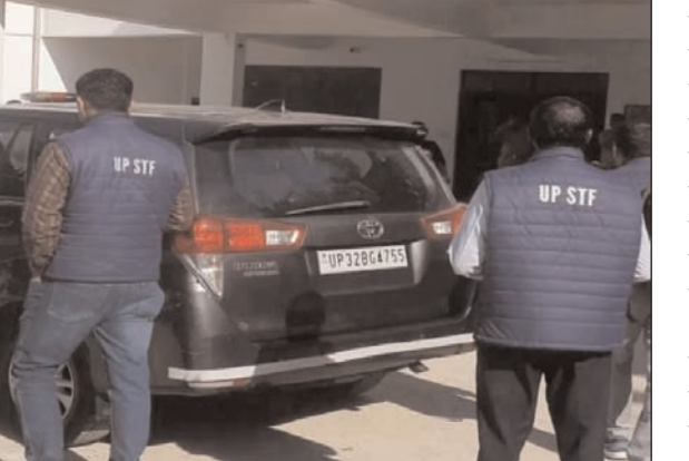
मंगलवार को बताया कि आज सुबह यूपी एसटीएफ की नोएडा यूनिट की