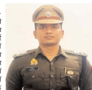
एसपी ने बदली थाना प्रभारियों की जिम्मेदारियां