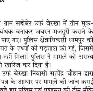
मजदूरों को बंधक बनाने का सनसनीखेज आरोप जांच में पूरी तरह भ्रामक मिला