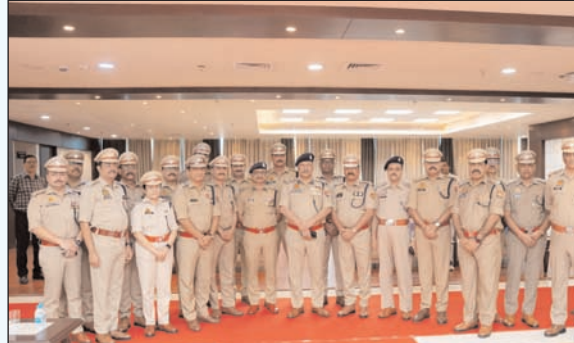
शुभकामनाएं दी गयी। डीजीपी ने पदोन्नति पाये सभी अधिकारियों को संबोधित करते हुये कहा कि पुलिस सेवा अत्यन्त चुनौतीपूर्ण कार्य है, जिस स्थान पर तैनाती मिले वहां पूर्ण निष्ठा एवं जिम्मेदारी के साथ अपने दायित्वों का निर्वहन करें।