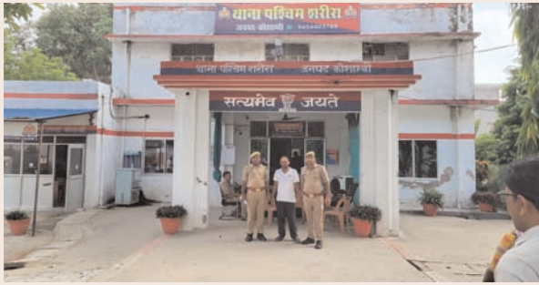
सम्बन्धित 2 अभियुक्तों को पुलिस मुठभेड़ में गिरफ्तार किया जा चुका है।