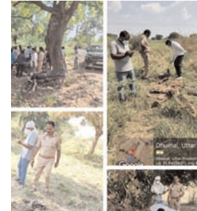
टैग लगे गौवंशों के अवशेष धुमाई के जंगल में मिलने से हड़कंप, गोकशी के आरोप और प्रशासन का अलग दावा