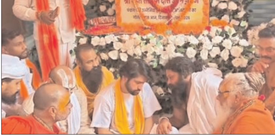
भगवान भी दंड देगे बागेश्वरधाम पीठाधीश्वर धीरेंद्र कृष्ण शास्त्री शुकुवार को इससे पहले महर्षि बाल्मीकि अंतरराष्ट्रीय एयरपोर्ट संतों और अनुयायियों ने भव्य स्वागत किया। इस दौरान उन्होंने