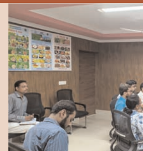
किसान क्रेडिट कार्ड संतुष्टिकरण अभियान के बारे में सीडीओ ने की समीक्षा

सहभागिता रहे तथा शिविरों में आवश्यक बैंक प्रतिनिधियों की