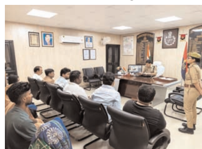
कमान ने कार्यालय में पीड़ितों की सुनी फरियाद