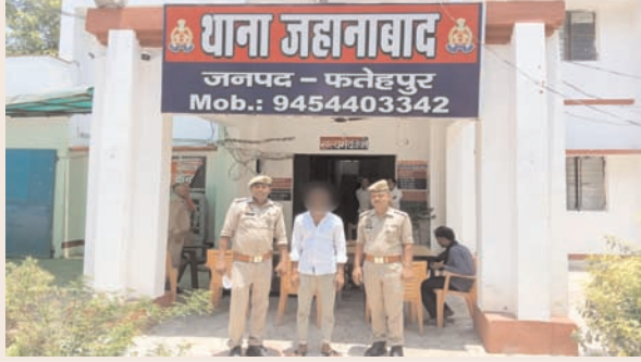
को उसके घर से गिरफ्तार कर लिया। तलाशी के दौरान घटना में प्रयुक्त मोबाइल फोन बरामद किया गया।