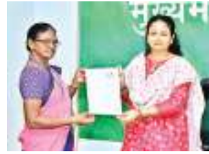
की। मौके पर मुख्यमंत्री हेमन्त सोरेन की धर्मपत्नी एवं विधायक कल्पना सोरेन ने भी स्वयं अपना एन्यूमरेशन प्रपत्र भरकर जमा किया। मुख्यमंत्री ने राज्य के समस्त मतदाताओं से अपील करते हुए कहा कि वे समय पर अपना एसआईआर प्रपत्र भरें तथा मतदाता सूची में अपनी