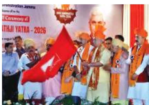
व्यवस्था के तहत सुरक्षा कर्मियों की निगरानी में ले जाया गया। उप राज्यपाल मनोज सिन्हा ने तीर्थयात्रियों को शुभकामनाएं दीं और कहा कि यात्रा को सुरक्षित, सुचारू और परेशानी-मुक्त बनाने

कर रहे हैं, जबकि 2,312 ने छोटे बालटाल रास्ते को चुना है। पहले गुरुवार को औपचारिक रूप से शुरू हो गई। जम्मू-कश्मीर के उप राज्यपाल मनोज सिन्हा ने कड़े सुरक्षा इंतजामों के बीच जम्मू के भगवती नगर यात्री निवास से तीर्थयात्रियों के पहले जत्थे को हरी झंडी दिखाकर रवाना किया। अधिकारियों ने बताया कि कुल 4,822 तीर्थयात्री 259 गाड़ियों के काफिले में जम्मू से बालटाल और पहलगांम के दो बेस कैम्पों के लिए रवाना हुए। इनमें से 2510 तीर्थयात्री पारंपरिक पहलगांम रास्ते से यात्रा