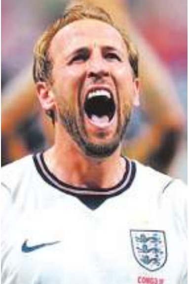
टीम की बढ़त बरकरार रखी। पहले हाफ में जूड बेल्लिंगम का हेडर और मार्कस रेशफोर्ड