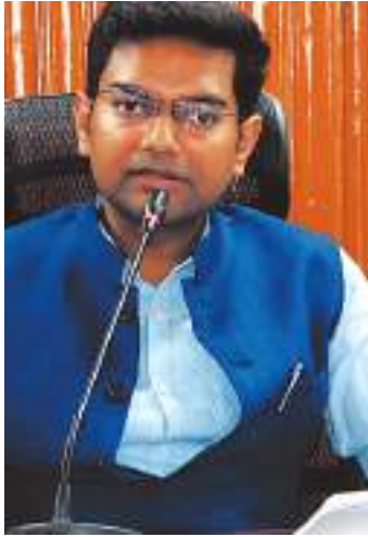
मैनपावर की कमी आड़े आती है तो अतिरिक्त कर्मियों की व्यवस्था कर कार्यों

संवाददाता दुमका। उपायुक्त अभिजीत सिन्हा ने जिले में विद्युत आपूर्ति व्यवस्था को अधिक सुचारु, निबंध और जनहित के अनुरूप बनाने के उद्देश्य से बिजली विभाग के अधिकारियों के साथ समीक्षा बैठक की। बैठक में जिले के विभिन्न क्षेत्रों में बिजली आपूर्ति, मेटेनेंस कार्य, ट्रांसफॉर्मर बदलने की प्रक्रिया तथा विद्युत व्यवस्था से जुड़े अन्य महत्वपूर्ण बिंदुओं पर विस्तार से चर्चा की गई। समीक्षा के दौरान उपायुक्त ने अधिकारियों को स्पष्ट निर्देश दिया कि बिजली मेटेनेंस से संबंधित सभी कार्यों में तेजी लाई जाए और उन्हें निर्धारित समय-सीमा के भीतर गुणवत्तापूर्ण तरीके से पूरा किया जाए। उन्होंने कहा कि यदि किसी कार्य में