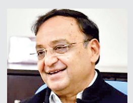
● पूर्व सांसद बोलें एक देश, एक कर का सपना हुआ साकार

रांची। वस्तु एवं सेवा कर (जीएसटी) के सफलतापूर्वक 9 वर्ष पूरे होने पर भाजपा नेता एवं राज्यसभा के पूर्व सांसद महेश पोद्दार ने देशवासियों को बधाई देते हुए इसे भारतीय अर्थव्यवस्था का सबसे बड़ा कर सुधार बताया। उन्होंने कहा कि जीएसटी ने देश को आर्थिक रूप से एक सूत्र में पिरोने का कार्य किया है और 'एक देश, एक कर' की अवधारणा को सफलतापूर्वक साकार किया है। महेश पोद्दार ने कहा कि उन्हें भाजपा की ओर से राज्यसभा में अपना पहला (मेडन) भाषण जीएसटी विधेयक पर देने का अवसर मिला था। महेश पोद्दार कार्यकाल के दौरान उन्होंने जीएसटी के विभिन्न पहलुओं और इसके दूरगामी लाभों पर सदन में कई महत्वपूर्ण वक्तव्य दिए। उन्होंने कहा कि भारत के