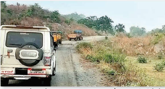
हूप पुलिस ने आसेहार-सगल्लिम क्षेत्र से अवैध बालू लदे तीन ट्रैक्टर जब्त किए हैं। इस कार्रवाई से क्षेत्र के बालू माफियाओं एवं अवैध

पांकी। राष्ट्रीय हरित प्राधिकरण (एनजीटी) द्वारा बालू उठाव पर प्रतिबंध के बावजूद अवैध परिवहन करने वालों के खिलाफ पांकी पुलिस ने बड़ी कार्रवाई की है। गुप्त सूचना के आधार पर छापेमारी करते