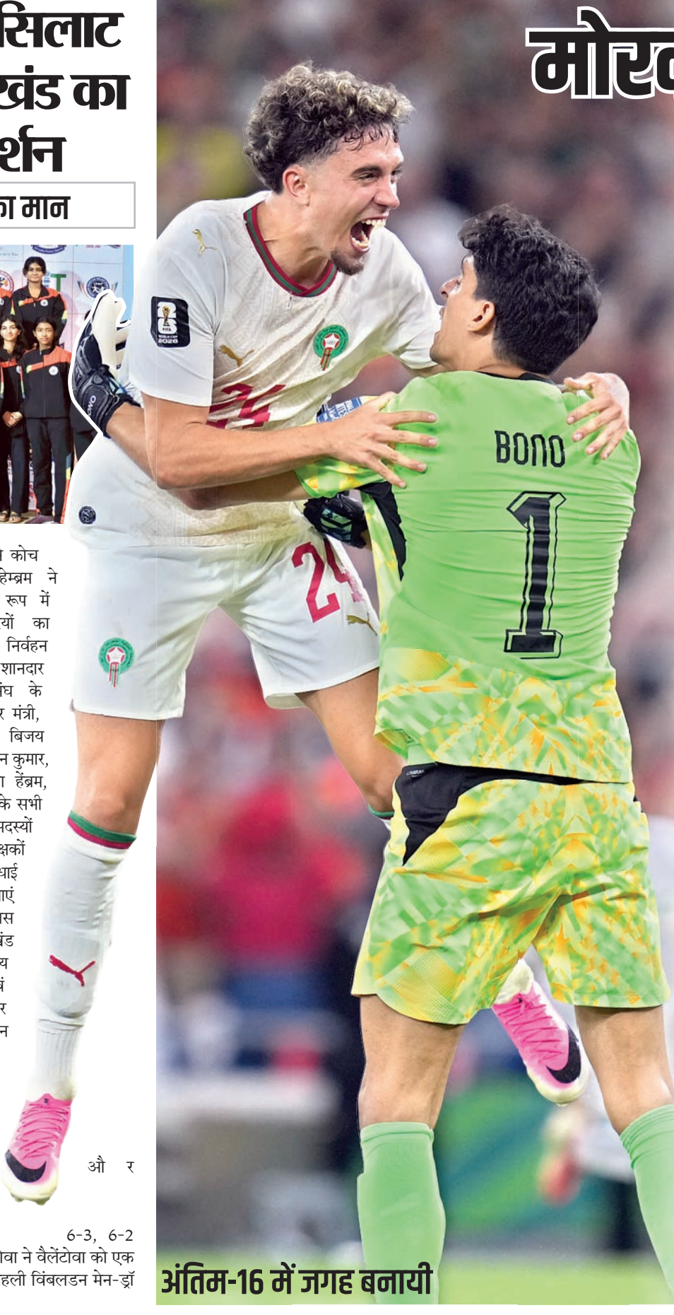
अंतिम-16 में जगह बनायी