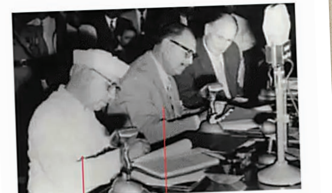
जवाहरलाल नेहरू (पीएम, भारत) और अयूब खान (राष्ट्रपति, पाकिस्तान)

1960 भारत के पीएम नेहरू और पाकिस्तान के राष्ट्रपति अयूब खान के बीच दस्तखत हुए थे।