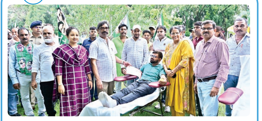
हूल दिवस पर सिदो-कान्हू उद्यान परिसर में आयोजित रक्तदान शिविर में शामिल होकर रक्तदाताओं के बीच प्रशस्ति-पत्र वितरण करते हुए मुख्यमंत्री हेमंत सोरेन।