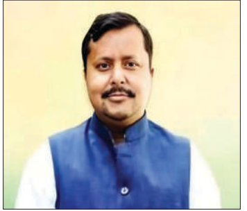
केजरीवाल की इस प्रतिक्रिया के बाद राम मंदिर से जुड़े मुद्दे भी राजनीतिक बहस का हिस्सा बन गए हैं। फिलहाल भाजपा और आम आदमी पार्टी के बीच सोशल मीडिया के जरिए आरोप-प्रत्यारोप का दौर जारी है, जिससे राजनीतिक माहौल और गर्म हो गया है।