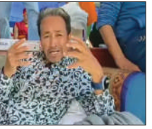
किलोग्राम कम हो गया है तथा उनका रक्तचाप लगातार गिर रहा है।

—प्रधानमंत्री विदेश यात्राओं में व्यस्त इन मुद्दों के लिए समय नहीं