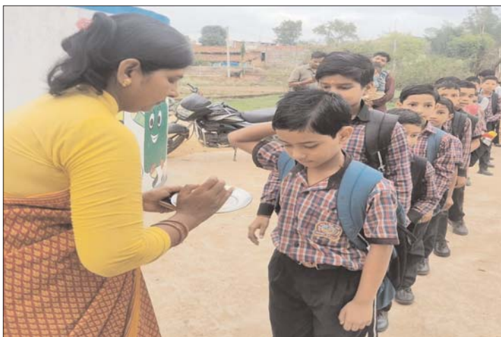
यह परीक्षा चार दिनों तक चलने वाली है। हमारे भैया- बहन पूर्ण मनोयोग से उत्साह