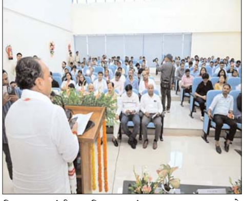
रिम्स, रांची स्थित संस्थान का उद्घाटन करते अत्याधुनिक क्षेत्रीय नेत्र हुए बोल रहे थे। इस दौरान