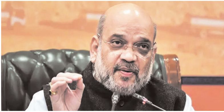
इसमें कोई दोराय नहीं कि भारतीय राजनीति में अपराधिक पृष्ठभूमि के लोगों का बढ़ता दखल आज एक गंभीर समस्या बन चुका है। मौजूदा कानूनी प्रावधानों के तहत तकनीकी जटिलताओं का लाभ उठाकर कई बार ऐसे लोग भी चुनकर संसद या विधानसभाओं में आ जाते हैं, जिन पर

मुख्यमंत्री या अन्य मंत्रियों को पांच साल से ज्यादा सजा के प्रावधान वाले गंभीर अपराधों के लिए गिरफ्तार किए जाने और लगातार तीस दिनों तक हिरासत में रखे जाने पर पद से हटाने का प्रस्ताव है। अगर विधेयक की जांच के बाद संयुक्त संसदीय समिति इसे अपनी मंजूरी दे देती है, तो संसद के मानसून सत्र में इस पर बहस की संभावना है। गौरतलब है कि पिछले वर्ष अगस्त में केंद्रीय गृहमंत्री ने संसद में यह विधेयक पेश किया था। हालांकि, विपक्षी दलों की ओर से उठाई गई कई आपत्तियों के बाद इसकी जांच के लिए संयुक्त संसदीय समिति का गठन किया गया था, लेकिन कांग्रेस सहित ज्यादातर विपक्षी दलों ने अपनी चिंताओं को नजरअंदाज किए जाने की आशंका के मद्देनजर समिति का बहिष्कार कर दिया था।