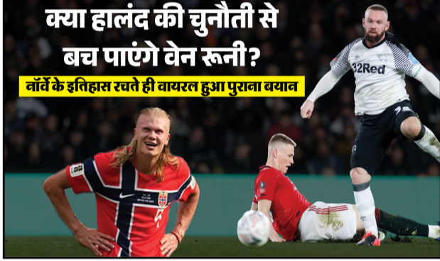
नॉर्वे के इतिहास रचते ही वायरल हुआ पुराना वादा

लंदन। नॉर्वे के पहली बार फीफा विश्व कप फाइनल में पहुंचने के बाद स्टार स्ट्राइकर एर्लिंग हालंद ने इंग्लैंड के पूर्व कप्तान वेन रूनी को उनका पुराना वादा याद दिलाया है। रूनी ने कथा था कि अगर नॉर्वे अंतिम-8 में पहुंचा तो वह मर्सी नदी में नाव चलाएंगे। इस बीच डॉटमुड अध्यक्ष ने हालंद के भविष्य को लेकर भी बड़ा दावा किया है। फीफा विश्व कप 2026 में नॉर्वे ने इतिहास रचते हुए पहली बार फाइनल में जगह बनाई है।