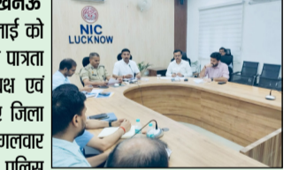
लखनऊ में यूपीटीआईटी-2026 की तैयारियां पूरी, 46 केंद्रों पर 96,454 अर्थव्ययों दौरे परीक्षा