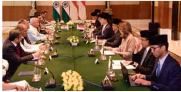
एजेंसी। नई दिल्ली

विदेश मंत्री डॉ. एस. जयशंकर ने रविवार को नई दिल्ली में इंडोनेशिया के विदेश मंत्री सुगियोनो के साथ 8वीं भारत-इंडोनेशिया संयुक्त आयोग बैठक (जेसीएम) की सह-अध्यक्षता की। विदेश मंत्रालय के अनुसार दोनों मंत्रियों ने भारत-इंडोनेशिया व्यापक रणनीतिक साझेदारी के तहत द्विपक्षीय संबंधों के सभी पहलुओं की समीक्षा की। साथ ही, उन्होंने राजनीतिक, रक्षा और सुरक्षा, समुद्री व्यापार और निवेश, फार्मा और स्वास्थ्य सेवा, डिजिटल, ऊर्जा, कनेक्टिविटी, अंतरिक्ष, शिक्षा, कंसुलर और सांस्कृतिक क्षेत्रों तथा लोगों के बीच आपसी आदान-प्रदान में सहयोग को और मजबूत करने के तरीकों पर चर्चा की। मंत्रियों ने इस बात पर गौर किया कि राष्ट्रपति प्रभावों