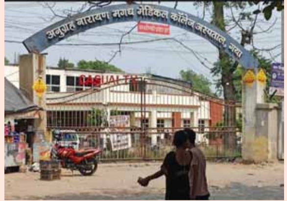
नई सोच एक्सप्रेस

गया जी। अनुग्रह मागध मेडिकल अस्पताल में जूनियर डॉक्टरों के आंदोलन का असर लगातार दूसरे दिन भी जारी रहा। अस्पताल की इमरजेंसी सेवा पूरी तरह ठप रही और मुख्य प्रवेश द्वार पर ताला जड़ा बहावताया जाता है कि इलाज के लिए पहुंचे मरीजों को बिना उपचार के लौटना पड़ रहा है जबकि गंभीर मरीजों को दूसरे अस्पतालों का सहारा लेना पड़ा। प्राप्त जानकारी के अनुसार, बीते दो दिनों में 200 से अधिक मरीज प्रभावित हुए हैं। आंदोलनकारी डॉक्टरों ने इमरजेंसी सेवाओं को पूरी तरह बंद कर रखा है। इमरजेंसी सेवा बंद रहने से मरीजों और उनके परिवारों को भारी परेशानियां का सामना करना पड़ रहा है। रिवॉवर होने के कारण अस्पताल प्रशासन और संबंधित अधिकारियों की ओर से इमरजेंसी सेवा बहाल कराने के लिए अपेक्षित सक्रियता नहीं दिखाई। इस स्थिति को लेकर मरीजों और उनके परिवारों में नाराजगी भी देखी गई। अस्पताल अधीक्षक डॉ.