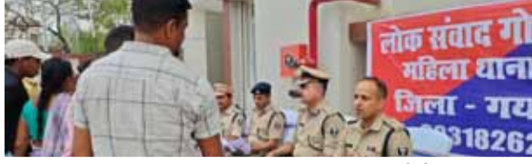
नई सोच एक्सप्रेस

गया जी। पुलिस महानिरीक्षक गया एवं वरीय पुलिस अधीक्षक गया की उपस्थिति में शुक्रवार को डेल्टा थाना क्षेत्र के बागेश्वरी परिसर तथा महिला थाना परिसर में लोक संवाद गोष्ठी का आयोजन किया गया। लोक संवाद गोष्ठी कार्यक्रम में डेल्टा थानाध्यक्ष, महिला थानाध्यक्ष सहित अन्य पुलिस पदाधिकारी मौजूद रहे। गोष्ठी के दौरान अधिकारियों ने आमजनों से संधे संवाद कर उनकी समस्याएं, शिकायतें और सुझाव सुने। जनहित से जुड़े विभिन्न मुद्दों पर जानकारी लेते