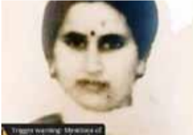
रालिब.. गालिब.. चालिब..