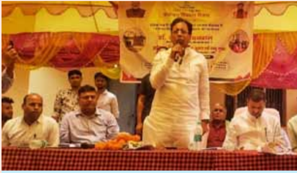
शिविर को संबोधित करते सांसद