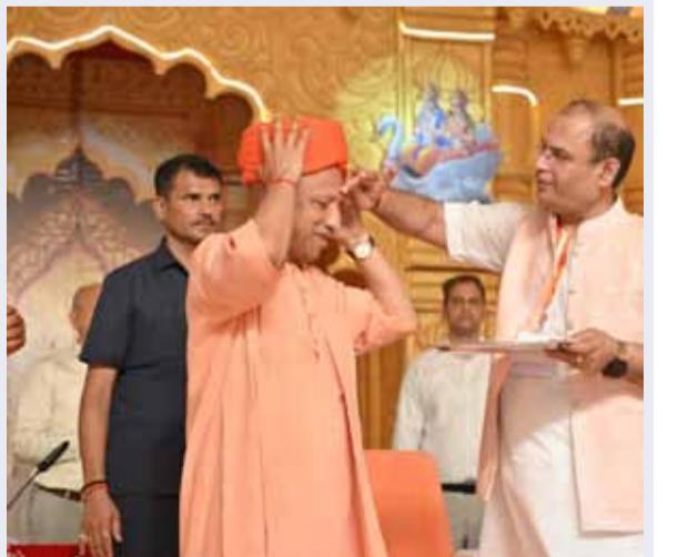
» पटना के सैकड़ों ने लिया धर्म लाभ संस्कृति, जैन दर्शन एवं तीर्थ विकास के महत्व पर प्रकाश डाला। अंत में मोक्षकल्याणक, मस्तकाभिषेक, निर्वाण लाडू समर्पण एवं कलशारोहण के साथ पंचकल्याणक प्रतिष्ठा महोत्सव सानंद सम्पन्न हुआ।