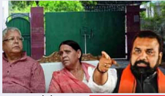
» लालू यादव की सेहत का दिया हवाला

पटना। बिहार की पूर्व मुख्यमंत्री राबड़ी देवी ने पटना के 10 सर्कुलर रोड स्थित सरकारी आवास को खाली करने के लिए बिहार सरकार से एक महीने का समय मांगा है। बिहार सरकार के भवन निर्माण विभाग की ओर से दिए गए 15 दिनों की समय सीमा समाप्त होने के बाद उन्होंने मुख्यमंत्री सम्राट चौधरी को पत्र लिखकर लालू यादव की खराब सेहत और संक्रमण के खतरे का हवाला दिया है। सरकार को लिखे पत्र में उन्होंने बताया है कि जब लालू प्रसाद यादव गंभीर बीमारी के बाद पटना लौटे थे, तब उनकी स्वास्थ्य आवश्यकताओं को देखते हुए तत्कालीन मुख्यमंत्री नीतीश कुमार की सहमति से सरकारी आवास में विशेष सुविधाओं वाला एक कमरा तैयार कराया गया था। भवन निर्माण विभाग द्वारा भूतल पर