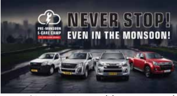
नई सोच एक्सप्रेस

पटना। इसुजु अपने ग्राहकों को बेमिसाल सेवाएं उपलब्ध कराने और वाहनों के मालिक के तौर पर उन्हें बेहतर अनुभव प्रदान करने के अपने वादे पर कायम है। अपने इसी वादे को और ज्यादा मजबूत करते हुए, इसुजु मोटर्स इंडिया की ओर से अपने इसुजु डी-मैक्स पिक-अप और एसयूवी रेंज के लिए एनआईआई आई-केयर प्री-मानसून कैंप का आयोजन किया जाएगा। इस सर्विस कैंप का उद्देश्य ग्राहकों को आकर्षक