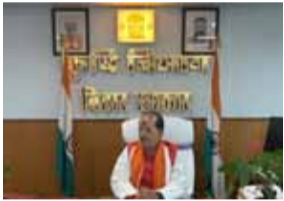
» फसल भंडारण और विपणन को मिलेगा बल, कृषि विभाग की 24 करोड़ रुपये की योजना से 4.48 लाख मानव दिवस रोजगार सृजित होंगे

पटना। कृषि मंत्री विजय कुमार सिन्हा ने बताया कि किसानों को कृषि उपज के सुरक्षित भंडारण तथा बेहतर विपणन सुविधाएं उपलब्ध कराने के उद्देश्य से वित्तीय वर्ष 2026-27 में प्रधानमंत्री राष्ट्रीय कृषि विकास योजना के अंतर्गत किसानों के लिए भंडारण गोदाम (100 एवं 200 मीट्रिक टन क्षमता) के निर्माण तथा पक्का थ्रेसिंग फ्लोर की स्थापना की महत्वाकांक्षी योजना संचालित की जाएगी। इस योजना के लिए कुल 24 करोड़ रुपये की निकासी एवं व्यय की स्वीकृति का प्रस्ताव है, जिसमें केंद्रांश 14.40 करोड़ रुपये तथा राज्यांश 9.60 करोड़ रुपये शामिल हैं। मंत्री ने कहा कि गोदाम निर्माण योजना का मुख्य उद्देश्य कृषि आधारित उद्यमिता को बढ़ावा देना तथा किसानों को उनकी उपज के लिए बेहतर विपणन सहायता उपलब्ध कराना है। अक्सर किसानों को फसल कटाई के तुरंत बाद कम कीमत पर अपनी उपज बेचनी पड़ती है। गोदाम