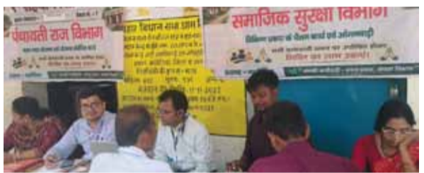
नई सोच एक्सप्रेस

बेतिया। मडौलिया प्रखंड के बैठनिया भानाचक, नौतन खुर्द तथा रामनगर बनकट पंचायत में मंगलवार को सहयोग शिविर का आयोजन किया गया। इसी कड़ी में राजकीय उत्कृष्ट माध्यमिक विद्यालय परिसर में कल्याण सहयोग शिविर का आयोजन गया। जहां विभिन्न विभागों द्वारा स्टील लगाकर आम लोगों की समस्याओं के समाधान एवं सरकारी योजनाओं की जानकारी उपलब्ध कराई गई। शिविर में पंचायती राज विभाग, स्वास्थ्य विभाग, शिक्षा विभाग, ग्राम कचहरी, कृषि विभाग सहित अन्य विभागों के अधिकारी एवं कर्मी उपस्थित रहे। लोगों ने अपनी समस्याओं और