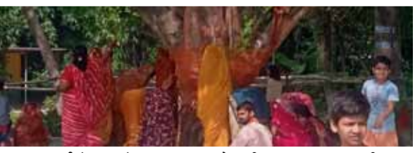
नई सोच एक्सप्रेस

वैशाली। प्रखंड के विभिन्न भागों में सुहागिन महिलाओं ने श्रद्धा व भक्ति के साथ पति के स्वस्थ व दीर्घायु जीवन की कामना से की और सोमवती अमावस्या का व्रत किया। पूरे वैदिक विधान के साथ सोलाहों श्रृंगार कर महिलाएं अपने-अपने क्षेत्र के विभिन्न देवस्थान पहुंचे और पीपल वृक्ष की जड़ में पूजा अर्चना की। शास्त्रों के अनुसार सोमवार के दिन पड़ने वाली अमावस्या को सोमवती अमावस्या कहा जाता है। हिंदू धर्म में