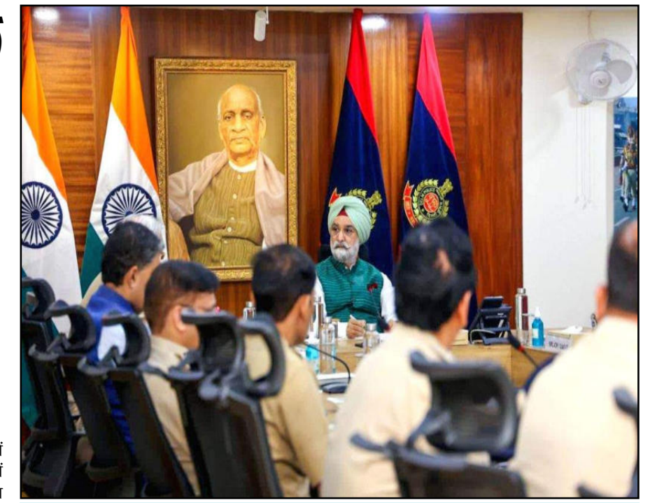
दिल्ली के उप-राज्यपाल तरनजीत सिंह संधू ने दिल्ली पुलिस के वरिष्ठ अधिकारियों से मुलाकात की और नई दिल्ली स्थित दिल्ली पुलिस मुख्यालय में कामकाज और कल्याण से जुड़ी अहम प्राथमिकताओं की समीक्षा की।

मुताबिक, जिस समय आग लगी, अधिकतर मजदूर अपने-अपने कमरों में सो रहे थे, जबकि कई लोग बाहर थे। आग लगने के बाद सभी सतर्क हो गए और बाहर निकल आए, जिससे किसी प्रकार की होई जनहानि नहीं हुई। यहां रहने वाले मजदूर बाहरी राज्यों के बताए जा रहे हैं। आग लगने से मजदूरों का सामान जलकर खाक हो गया है। बताया जा रहा है कि मजदूर सेंट्रल विस्टा परियोजना के निर्माण कार्य से जुड़े हैं।