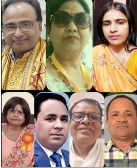
श्री राम राष्ट्रीय साहित्यिक संस्था अयोध्या धाम द्वारा अनेक साहित्यकारों ने सहभागिता की। अंत में सभी प्रतिभागियों का आभार व्यक्त किया गया।

पिलखुवा। अंतरराष्ट्रीय योग दिवस के उपलक्ष्य में