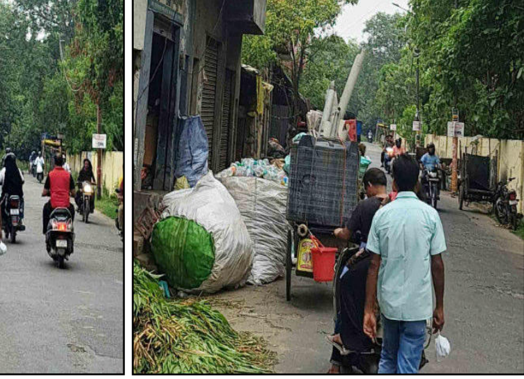
दुकानें खोल ली है। और कबाडियों ने सामान रखकर सड़क पर अवैध रूप से कब्जा कर लिया। जिससे कुष्ठ आश्रम रोड कबाड़ी रोड बनकर रह गया है। वहीं नगर पालिका परिषद के कर्मचारियों द्वारा कूड़े से भरे रिकशे खड़े

सत्यापन भी कराया जायेगा। वहीं नगर पालिका परिषद के अधिकारियों को निर्देशित किया जा रहा है, कि कुष्ठ आश्रम रोड पर कूड़े से भरे व खाली रिकशा खड़े नहीं किये जायें। गौरतलब है, कि आगामी माह में कांवड यात्रा शुरू होने जा रही है।