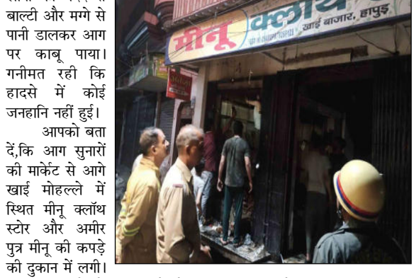
मीनू क्लॉथिंग स्टोर में नग, सितारे, बेल आदि का काम होता है, जबकि दूसरी दुकान में कपड़े और साड़ियां रखी थीं। फायर सर्विस यूनिट को सूचना मिलते ही टीम रवाना हुई, लेकिन रास्ता संकरा होने के कारण फायर