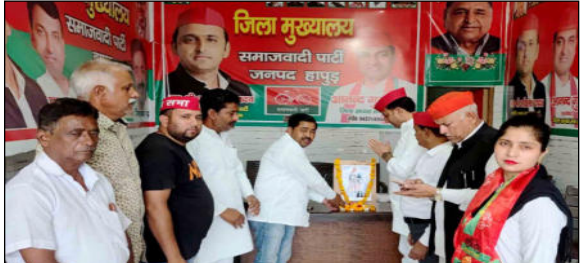
गरिमायवी तरीके से मनाया गया। जिला कार्यालय पर उपस्थित पार्टी पदाधिकारियों व कार्यकर्ताओं ने वीरगंगा महारानी दुर्गावती के शौर्य को नमन किया व पुष्प अर्पित करके श्रद्धांजलि दी साथ ही लखनऊ में कोचिंग पढ़ रहे विद्यार्थियों के साथ हुई हृदय विदारक घटना में जान गंवाने वाले छात्रों व छात्राओं को

हापुड़। बुधवार को समाजवादी पार्टी जिला कार्यालय पर वीरगंगा महारानी दुर्गावती का बलिदान दिवस अत्यंत