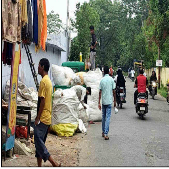
पालिका परिषद के कूड़े से भरे रिकशे खड़े होने से लोगों को निकलना वहां से दुर्भर हो गया है। आगामी माह में शुरू होने जा रही कांवड यात्रा के दौरान उक्त मार्ग से हजारों की संख्या में शिव भक्तों गुजरेंगे। इसके बावजूद भी नगर पालिका परिषद

करने से मार्ग पर दुर्गंध फैली रहती है। जिससे लोगों से वहां से निकलना दुर्भर हो गया है। इस सम्बंध में सदर इला प्रकाश का कहना है, कि कुष्ठ आश्रम रोड से सड़क से अवैध अतिक्रमण हटवाने के साथ-साथ शहर में कबाडियों का