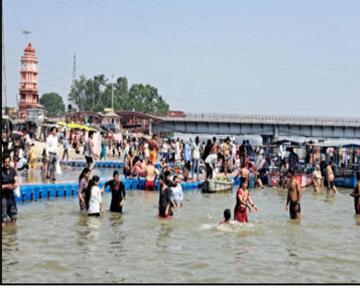
पुलिस प्रशासन द्वारा ज्येष्ठ गंगा दशहरा पर्व पर श्रद्धालुओं की सुरक्षा व्यवस्था के पुख्ता इंतजाम किये गये थे। मेला स्थल पर ड्रोन कैमरे से कड़ी नजर रखी गयी। डोंग स्वभावयड से सौंदर्य स्थानों व लोगों की चेकिंग भी कराई

के लिए रवाना हो गये। रविवार की शाम तक श्रद्धालुओं के आने का आने जाने का क्रम जारी था। ज्येष्ठ गंगा दशहरा पर्व पर गढ़मुक्तेश्वर व ब्रजघाट एवं पुष्पावती पूठ घाट स्थित गंगा नदी में लाखों श्रद्धालुओं ने स्नान किया।