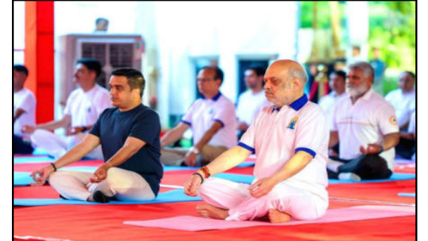
केंद्रीय गृह और सहकारिता मंत्री अमित शाह ने गुजरात के अहमदाबाद में अंतरराष्ट्रीय योग दिवस के अवसर पर योग किया।