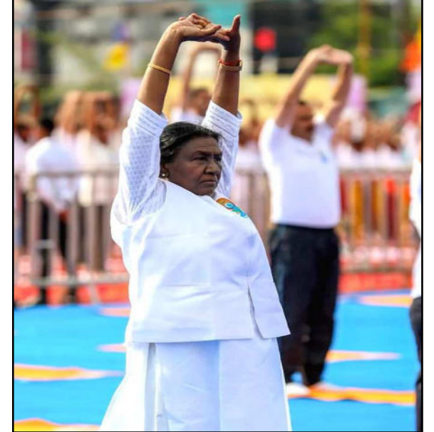
राष्ट्रपति द्रौपदी मुर्मू ने मध्य प्रदेश के जबलपुर में अंतरराष्ट्रीय योग दिवस समारोह के दौरान योग किया।

उच्चायुक्त दिनेश त्रिवेदी ने ढाका में आयोजित योग दिवस समारोह में भाग लिया। प्रधानमंत्री मोदी ने पहली बार 27 सितंबर, 2014 को संयुक्त राष्ट्र महासभा में अंतरराष्ट्रीय योग दिवस मनाने का प्रस्ताव रखा था। भारत के इस प्रस्ताव को 177 देशों ने समर्थन दिया और महज 3 महीने के अंदर यानी 11 दिसंबर, 2014 को संयुक्त राष्ट्र ने 21 जून को अंतरराष्ट्रीय योग दिवस के रूप में मनाने की घोषणा की। इसके बाद पहला अंतरराष्ट्रीय योग दिवस 21 जून, 2015 को मनाया गया था।