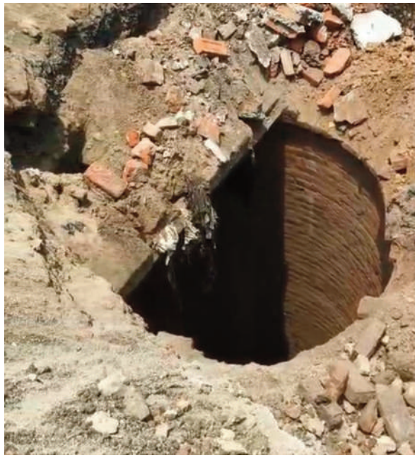
जानकारी जारी नहीं की गई है। लेकिन स्थानीय लोगों को उम्मीद है कि प्रशासन और पुरातत्व विभाग इस ऐतिहासिक संरचना का महत्व

शहीत स्थानीय नागरिकों और इतिहास में रुचि रखने वाले लोगों का कहना है कि स्टेशन पुनर्विकास कार्य के दौरान मिले इस कुएं की वैज्ञानिक एवं पुरातात्विक जांच कराई जानी चाहिए। उनका मानना है कि यदि यह संरचना ऐतिहासिक रूप से महत्वपूर्ण साबित होती है तो भारतीय पुरातत्व सर्वेक्षण (एएसआई) अथवा राज्य के संबंधित पुरातत्व विभाग द्वारा इसका विस्तृत सर्वे कराया जाए और इसे संरक्षित धरोहर के रूप में विकसित किया जाए। इससे न केवल गया के समृद्ध इतिहास की नई जानकारी सामने आएगी बल्कि शहर की सांस्कृतिक पहचान को भी मजबूती मिलेगी। विशेषज्ञों का मानना है कि ऐसे ऐतिहासिक अवशेषों का संरक्षण भविष्य की पीढ़ियों के लिए आवश्यक है। फिलहाल रेलवे की ओर से इस कुएं के संबंध में कोई आधिकारिक