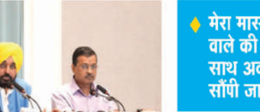
उन्होंने महाराष्ट्र सरकार से सिखों के धार्मिक मामलों में हस्तक्षेप न करने की अपील की।

पंजाब के मुख्यमंत्री भगवंत सिंह मान ने रविवार को कहा कि श्री अकाल तख्त साहिब सिख कौम की सर्वोच्च धार्मिक संस्था है और उसके प्रत्येक आदेश का पूरी श्रद्धा व निष्ठा के साथ पालन किया जाएगा। उन्होंने बताया कि श्री अकाल तख्त साहिब द्वारा तलब किए गए पंजाब विधानसभा के स्पीकर सहित सभी मंत्री और विधायक सोमवार को यहां उपस्थित होकर राज्य सरकार का पक्ष रखेंगे। श्री अमृतसर साहिब में आम आदमी पार्टी के राष्ट्रीय संयोजक अरविंद केजरीवाल के साथ मीडिया से बातचीत में मुख्यमंत्री ने कहा कि सरकार उनकी नकल करने वाले व्यक्ति की फर्जी वीडियो से संबंधित समस्त विवरण भी श्री अकाल तख्त साहिब को सौंपेगी। मुख्यमंत्री ने कहा कि विपक्षी दल इस मुद्दे को धार्मिक रंग देकर राजनीतिक लाभ लेने का प्रयास कर रहे हैं। उन्होंने स्पष्ट किया कि राजनीति और धर्म को कभी भी एक-दूसरे के साथ नहीं मिलाया जाना चाहिए। साथ ही