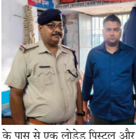
कोच की बर्थ संख्या 48 पर सवार एक व्यक्ति शराब के नशे में पिस्टल लहरा रहा है तथा यात्रियों को धमकी दे रहा है। सूचना मिलते ही ट्रेन के कोडरमा स्टेशन पहुंचने पर प्रभावी निरीक्षक के निदेश पर आरपीएफ और जीआरपी की संयुक्त टीम ने कार्रवाई की। जांच के दौरान पाया गया कि उक्त व्यक्ति कमर में पिस्टल लगाए कोच में इधर-उधर घूम रहा था और यात्रियों के बीच दहशत फैलाने के लिए धमकी भरे शब्दों का इस्तेमाल कर रहा था। उन्होंने बताया कि पुलिस टीम ने उसे ट्रेन से उतारने का प्रयास किया तो उसने आरपीएफ और जीआरपी जवानों के

कोडरमा स्टेशन पर आरपीएफ-जीआरपी की संयुक्त कार्रवाई में आरोपी गिरफ्तार