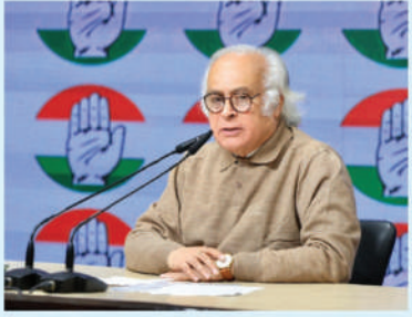
अधिनियम (मनरेगा) को समाप्त करने संबंधी विधेयक संसद से पारित करा दिया।

कांग्रेस ने विकसित भारत-रोजगार और आजीविका मिशन (ग्रामीण) गारंटी योजना (वीबी-जी राम जी) को लेकर कई राज्यों द्वारा नई योजना पर गंभीर आपत्तियां जताए जाने का दावा किया है। पार्टी के अनुसार, मध्य प्रदेश, बिहार और उत्तराखंड जैसे भाजपा शासित राज्यों ने राज्यों पर पड़ने वाले अतिरिक्त वित्तीय बोझ पर सवाल उठाए हैं। इसके अलावा कम से कम पांच राज्यों ने ग्रामीण श्रमिकों की मजदूरी बढ़ाने की मांग की है।