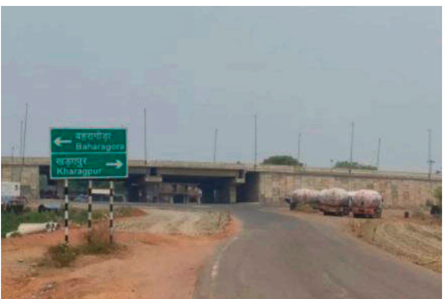
मथुरा स्थित मेसर्स एसआर-एससी इंफ्रा प्राइवेट लिमिटेड को इस कार्य के लिए दो पैकेजों में कुल 214.79 करोड़ की लागत से कार्य आवंटित किया गया है। निर्माण कार्य भारतीय सड़क कांग्रेस के मानकों, स्वीकृत तकनीकी विनिदेशों एवं गुणवत्ता नियंत्रण प्रक्रियाओं के अनुरूप किया जाएगा। इस महत्वपूर्ण

रांचीमहुलिया खंड राज्य की राजधानी रांची को औद्योगिक नगरी जमशेदपुर से जोड़ने वाला प्रमुख परिवहन गलियारा है। इस मार्ग पर प्रतिदिन भारी वाणिज्यिक वाहनों, यात्री बसों, खनिज परिवहन वाहनों तथा स्थानीय यातायात का व्यापक आवागमन होता है। लगातार भारी यातायात, मानसून के दौरान जल प्र-