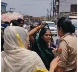
हाथरस में देसी शराब ठेका बंद कराने के लिए महिलाओं ने किया प्रदर्शन, हंगामा