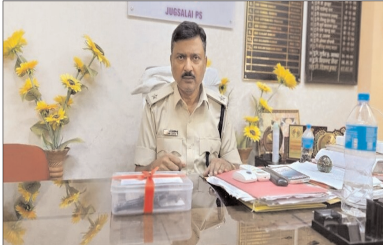
तलाशी ओकेते उनी ठेन खोन मित्तेन देशी कट्ट आर जिवेत्कारतुसको जाम केदा। पुलिस दो नाबालोक दोहड़ ते बाल सुधार गृह तेको कोल केदेया। मामला रेयाक् लाहा सेच् जांच चालाक् काना।