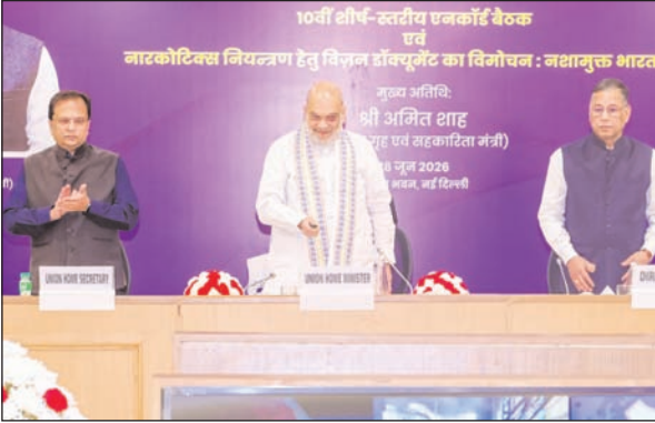
गृह मंत्री ने कहा कि नशे के कारोबार के खिलाफ हमारी लड़ाई समान्य नहीं होनी चाहिए: शाह

इस दौरान गृह मंत्री ने मादक पदार्थ नियंत्रण पर विजन डॉक्यूमेंट (2026-2029) जारी किया। साथ ही शाह ने एनसीबी वार्षिक रिपोर्ट - 2025 जारी की और जम्मू एवं गुवाहाटी में नवनिर्मित एनसीबी