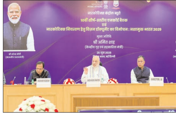
गृह मंत्री ने कहा कि नशे के कारोबार के खिलाफ हमारी लड़ाई समान्य नहीं होनी चाहिए: शाह

लिफ्ट नशे के कारोबार पर संपूर्ण विजय जरूरी है। भारत नशे के कारोबार से जुड़े डेथ ट्रायंगल (व्यांगार, थाईलैंड और लाओस) और डेथ क्रिसन