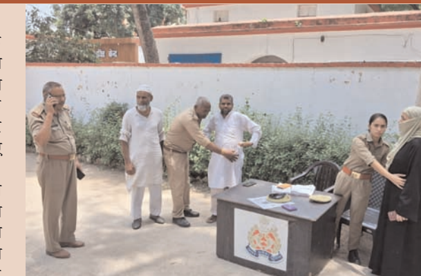
एसपी कार्यालय के गेट पर एसपी की बनाया जा रहा है, जहां

विभाग में हड़कंप मच गया है। घटना के मद्देनजर जिले के पुलिस अधीक्षक (रह) कार्यालय और सभी थानों में चौकसी बढ़ा दी गई है। एसपी कार्यालय के दोनों गेटों पर अब महिला और पुरुष पुलिसकर्मी तैनात किए गए हैं। कार्यालय में प्रवेश करने वाले प्रत्येक फरियादी की तलाशी ली जा रही है। उनसे आने का कारण पूछा जा रहा है और केवल पीड़ित व्यक्ति को ही तलाशी के बाद अंदर जाने की अनुमति मिल रही है।