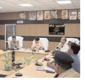
जिलाधिकारी एवं पुलिस अधीक्षक द्वारा संबंधित को निर्देशित किया गया कि गैंगस्टर एक्ट के मामलों में प्रभावी एवं सशक्त पैरवी सुनिश्चित करते हुए दोषियों को शीघ्र दण्डित कराया जाए। बैठक में अभियोजन अधिकारियों एवं विवेककों को आपसी समन्वय स्थापित कर न्यायालय में साक्ष्यों एवं गवाहों की समयबद्ध प्रस्तुति सुनिश्चित करने के निर्देश दिए गए। साथ ही गैंगस्टर एक्ट के अंतर्गत अपराधियों के विरुद्ध की जा रही वैधानिक कार्यवाहियों में तेजी लाने तथा लंबित प्रकरणों का गुणवत्तापूर्ण निस्तारण सुनिश्चित करने पर विशेष बल दिया गया।