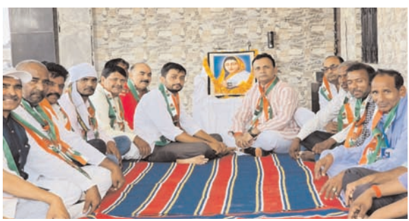
अहिल्याबाई होलकर जी की जयंती मनाई गई।

अहिल्याबाई होलकर एक अद्वितीय शासिका थीं-गौरव को जनता से छुड़ाया वह दुर्भाग्यपूर्ण है कि प्रधानमंत्री मोदी बनारस से सांसद हैं और उनके ही राज में उन्हीं की सरकार इस तरीके का कृत्य कर रही है आम जनता अब इनके बहकवचों में नहीं आयेगी वह सबकुछ देख रही है कि किस तरह से उन्हें भ्रमित कर भाजपा अपना काम निकाल रही है भाजपा इसका जवाब वह आने वाले चुनावों में देगी।