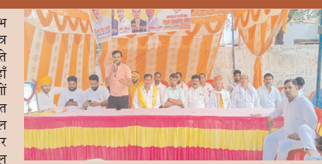
शोभायात्रा का शुभारंभ हुआ।

ब्यूरो चीफ सबसे तेज प्रयागराज कौशांबी। कड़ा विकास खण्ड के अंतर्गत गिरधरपुर गढ़ी गांव में रविवार को लोकमता अहिल्याबाई होलकर की 301वीं जयंती के अवसर पर एक भव्य शोभायात्रा का आयोजन किया गया इस दौरान पूरा क्षेत्र माता अहिल्याबाई के जयकारों से गुंजायमान हो उठा गिरधरपुर गढ़ी से पारंपरिक रीति-रिवाज और गाजे-बाजे के साथ शोभायात्रा का शुभारंभ हुआ। भव्य शोभायात्रा क्षेत्र के विभिन्न प्रमुख मार्गों से होते हुए देवीगंज बाजार पहुंची जहाँ स्थानीय व्यापारियों और ग्रामीणों ने यात्रा का जोरदार स्वागत किया। शोभायात्रा में शामिल युवा माता अहिल्याबाई होलकर अमर रहें के नारे लगाते हुए चल पूरा क्षेत्र माता अहिल्याबाई के जयकारों से गुंजायमान हो उठा गिरधरपुर गढ़ी से पारंपरिक रीति-रिवाज और गाजे-बाजे के