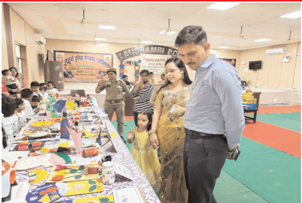
बच्चों को बुक फेयर का आयोजन किया गया।