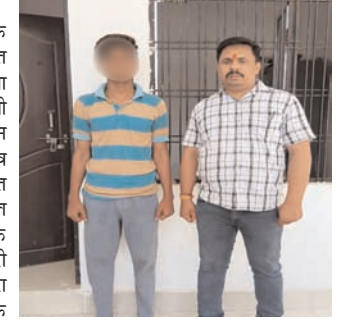
अपचारी को पुलिस संरक्षण में लिया गया।