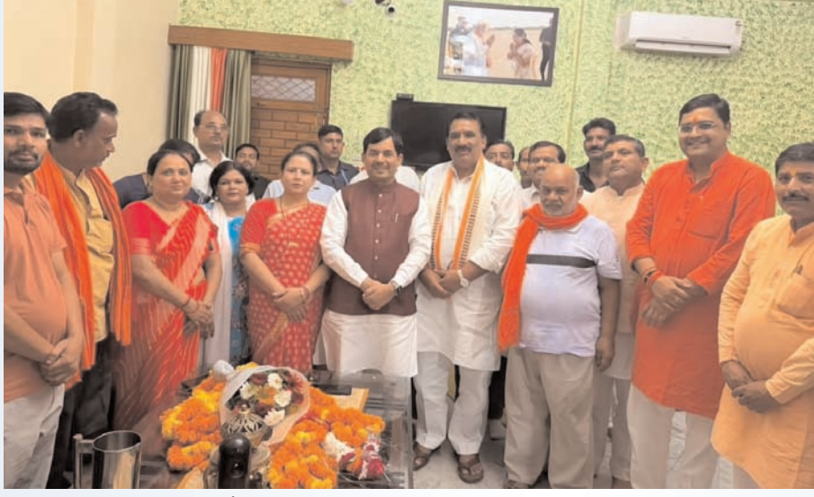
जिलाध्यक्ष सविता मिश्रा के नैनी स्थित आवास पर भव्य स्वागत किया गया। इस अवसर पर बड़ी संख्या में भाजपा पदाधिकारी एवं

सबसे तेज प्रयागराज प्रयागराज। भारतीय जनता पार्टी के राष्ट्रीय प्रवक्ता एवं पूर्व केंद्रीय मंत्री सैयद शाहनवाज हुसैन मंगलवार को मिजापुर जाते हुए प्रयागराज के नैनी इलाके में रुके। बड़ी संख्या में पार्टी पदाधिकारियों ने मौके पर पहुंचकर उनका भव्य स्वागत किया। इस दौरान कार्यकर्ताओं का उत्साह बढ़ाते हुए श्री हुसैन ने कहा कि प्रधानमंत्री नरेंद्र मोदी और मुख्यमंत्री योगी आदित्यनाथ की अगुवाई में देश और उत्तर प्रदेश आगे बढ़ रहा है। सरकार की जनकल्याणकारी योजनाओं को लेकर कार्यकर्ता घर घर जाएं। आगामी विधानसभा चुनाव में भाजपा की पूर्ण बहुमत की सरकार होगी। पार्टी के यमुनानगर जिलाध्यक्ष राजेश शुक्ल के नेतृत्व में भाजपा जिला उपाध्यक्ष एवं महिला मोर्चा