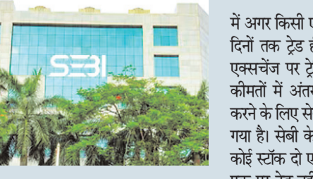
एक्सचेंज अपना क्लोजिंग प्राइस देता है। ऐसे

हलचल है जबकि दूसरे में निवेशक शांत हैं। इसी वजह से कीमतों में अंतर पैदा हो जाता है। इस समय जो नियम लागू हैं उसके अनुसार ऐसे स्टॉक जो डेरिवेटिव सेगमेंट में ट्रेड नहीं करते हैं उनके लिए एक स्पेशल प्राइस बैंड लागू होता है। यह पिछले दिनों की क्लोजिंग की तुलना में 20 प्रतिशत तक हो सकता है। पिछले दिनों की क्लोजिंग प्राइस प्री ओपनिंग सेशन के लिए रेफरेंस का भी काम करता है। बता दें, हर एक