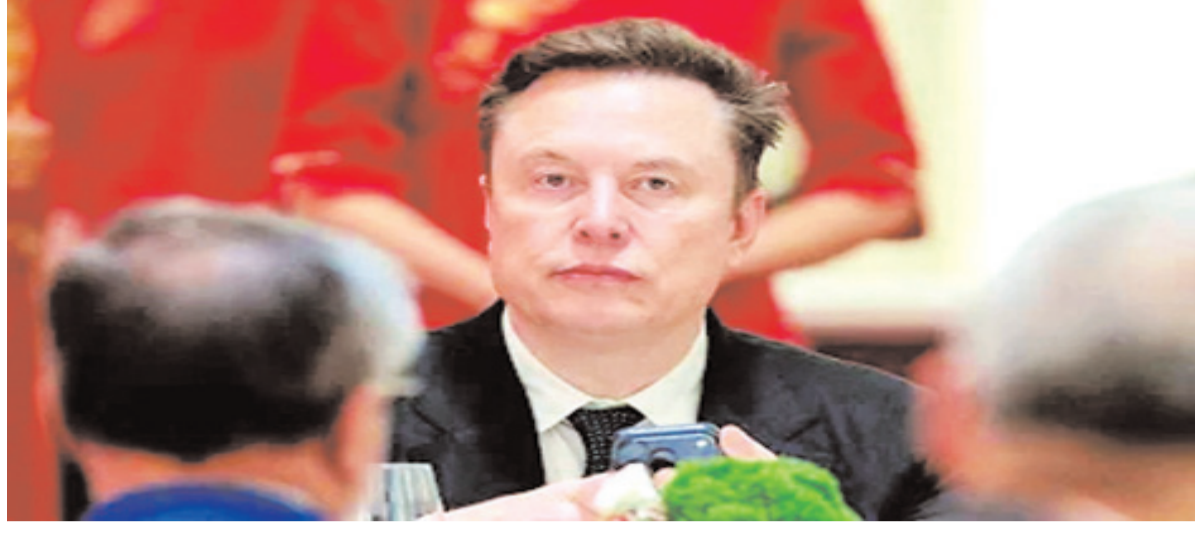
रॉकेट की रफतार दे दी है। मस्क इलेक्ट्रिक कार बनाने वाली कंपनी के सीईओ हैं और कंपनी में उनकी करीब 11 प्रतिशत हिस्सेदारी है। हालांकि अब उनकी सबसे बड़ी संपत्ति बन

जून 2026 में के शेयरों का वैल्युएशन 135 डॉलर प्रति शेयर के ऑफर प्राइस पर किया गया, जिससे मस्क की हिस्सेदारी का मूल्य अचानक बढ़ गया। इसके अलावा मई 2026 में से जुड़ी 45 अरब डॉलर की लायबिलिटी को उनकी नेटवर्थ गणना से हटा दिया गया। इससे भी उनकी कुल संपत्ति में भारी बढ़ोतरी दर्ज हुई। मस्क के पास लगभग 4.76 अरब शेयर हैं। कंपनी के नए वैल्युएशन ने उनकी संपत्ति को