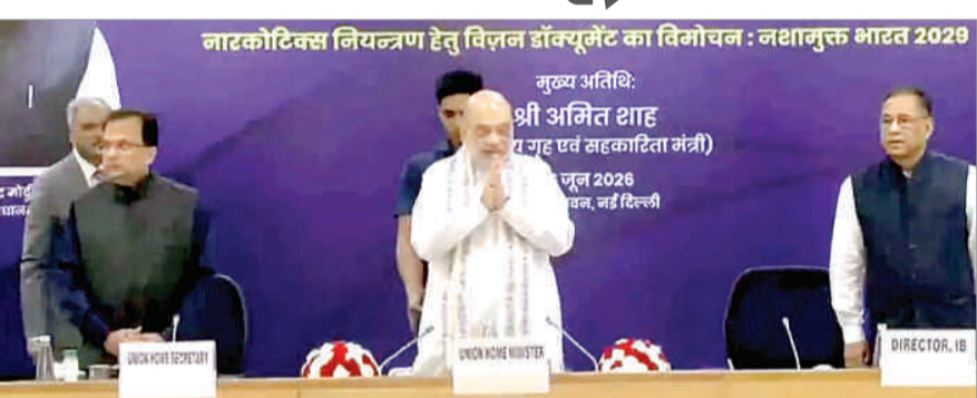
नार्कोटिक्स नियंत्रण हेतु विज्ञान डॉक्यूमेंट का विमोचन : नशा मुक्त भारत 2029

एजेंसी नयी दिल्ली : केन्द्रीय गृह मंत्री अमित शाह ने शुक्रवार को कहा कि नशे के खिलाफ लड़ाई में अगले तीन साल बेहद महत्वपूर्ण हैं। सरकार ने नशा मुक्त भारत के लिए रोडमैप तैयार कर लिया है। अगले तीन सालों के लिए हमें नशे से मुक्ति के लिए 'रूथलेस अप्रोच' के साथ आगे बढ़ना होगा। शाह ने राज्यों के पुलिस प्रमुखों और सचिवों के साथ बैठक में सामूहिक और संगठित प्रतिक्रिया तथा आधुनिक खूंफिया सुचना आधारित कार्रवाई, प्रौद्योगिकी आधारित रणनीति तथा पूरे नेटवर्क को लक्ष्य बना कर अभियान चलाने की आवश्यकता पर जोर दिया। केन्द्रीय गृह मंत्री अमित शाह ने शुक्रवार को नयी दिल्ली में नार्को-कोऑर्डिनेशन सेंटर (एनसीओआरडी) की 10वीं शीर्ष स्तरीय बैठक को अध्यक्षता की। बैठक में हाईब्रिड मोड में 44 केन्द्रीय मंत्रालयों और विभागों के प्रमुख हितधारकों के साथ-साथ राज्य सरकारों और इग कानून प्रवर्तन एजेंसियों के 108 प्रतिनिधियों ने भाग लिया। इस दौरान गृह मंत्री ने 'मादक पदार्थ नियंत्रण पर विजन डॉक्यूमेंट (2026-2029)' जारी किया। साथ ही, शाह ने एनसीबी वार्षिक