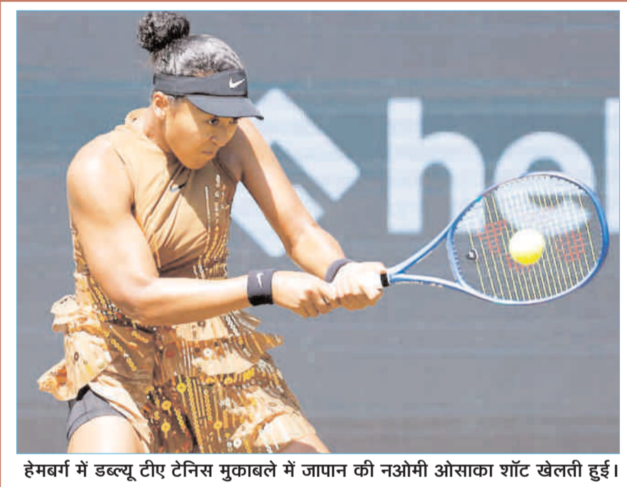
हेमवर्ग में डब्ल्यू टीए टेनिस मुकाबले में जापान की नओमी ओसाका शॉट खेलती हुई।