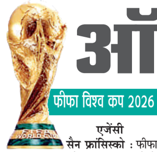
फीफा विश्व कप 2026