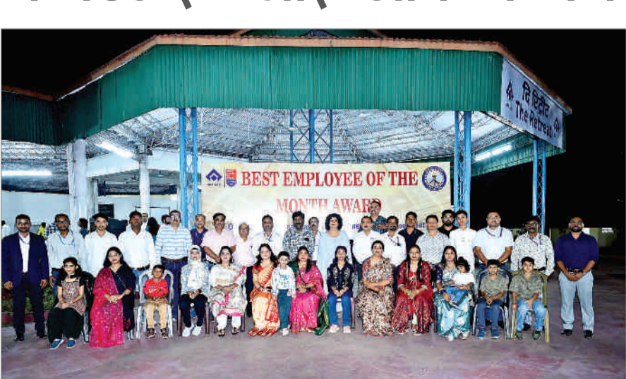
उनके परिवार का भी बहुत बड़ा योगदान है। उन्होंने आह्वान किया कि कर्मचारी दैनिक कार्यों के साथ-साथ नित नई चुनौतियों को स्वीकार करें और नवाचार के माध्यम से उनका समाधान खोजें ताकि संयंत्र के विकास की गति निरंतर बनी रहे। कार्यक्रम के दौरान अतिथियों ने चयनित कर्मचारियों को उनके कार्यक्षेत्र में उत्कृष्ट प्रदर्शन एवं विशिष्ट योगदान के लिए प्रशस्ति पत्र देकर सम्मानित किया। कार्यक्रम के दौरान कर्मचारियों तथा उनके परिजनों ने भी अपने अनुभव वीडियो क्लिप के द्वारा साझा