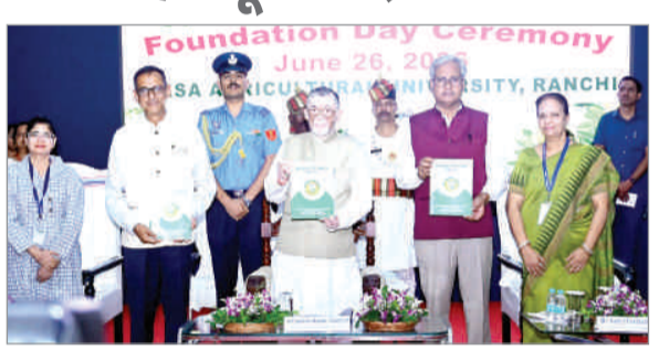
सम्बोधित कर रहे थे। इस अवसर पर उन्होंने विश्वविद्यालय की उपलब्धियों की सराहना करते हुए कहा कि कृषि शिक्षा का उद्देश्य केवल डिग्री प्रदान करना नहीं, बल्कि किसानों की समस्याओं का समाधान, नवाचार को बढ़ावा देना और कृषि को अधिक लाभकारी बनाना भी है। उन्होंने कहा कि

रांची : झारखंड के राज्यपाल एवं राज्य के विश्वविद्यालयों के कुलाधिपति संतोष कुमार गंगवार ने कहा कि बिरसा कृषि विश्वविद्यालय केवल एक शैक्षणिक संस्थान नहीं, बल्कि झारखंड के किसानों की आशाओं, आकांक्षाओं और ग्रामीण विकास का महत्वपूर्ण केन्द्र है। उन्होंने कहा कि विश्वविद्यालय ने अपनी स्थापना के बाद से शिक्षा, अनुसंधान और कृषि प्रसार कार्यक्रमों के माध्यम से किसानों के जीवन में सकारात्मक बदलाव लाने में उल्लेखनीय योगदान दिया है। राज्यपाल शुक्रवार को रांची स्थित बिरसा कृषि विश्वविद्यालय के 46वें स्थापना दिवस समारोह को