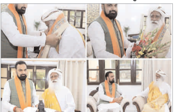
मुख्यमंत्री ने विश्वास जताया कि ऐसे संवाद समाज के समग्र विकास में महत्वपूर्ण भूमिका निभाते हैं। बैटक के दौरान बिहार में ईशा फाउंडेशन की ओर से संचालित सामाजिक, पर्यावरणीय और जनहित से जुड़े कार्यों की भी समीक्षा की गई। साथ ही राज्य में भविष्य में संचालित की जाने वाली विभिन्न परियोजनाओं पर विचार-विमर्श हुआ। पर्यावरण संरक्षण, जल एवं प्राकृतिक संसाधनों के संवर्धन, आध्यात्मिक जागरूकता, जनभागीदारी तथा नागरिक सुविधाओं से जुड़े कार्यक्रमों को आगे बढ़ाने के विषय पर भी चर्चा की गई। सद्गुरु जग्गी वासुदेव का यह बिहार का पहला प्रमुख

एजेंसी पटना : आध्यात्मिक गुरु सद्गुरु जग्गी वासुदेव शुक्रवार शाम तीन दिवसीय बिहार दौरे पर पटना पहुंचे। राजधानी पहुंचने के बाद उन्होंने मुख्यमंत्री आवास में बिहार के मुख्यमंत्री सम्राट चौधरी से मुलाकात की। मुख्यमंत्री ने सद्गुरु का पुष्पगुच्छ भेंटकर स्वागत किया और मुलाकात को आत्मीय, प्रेरणादायी तथा सार्थक बताया। मुख्यमंत्री सम्राट चौधरी ने कहा कि बैटक के दौरान बिहार की समृद्ध सांस्कृतिक, आध्यात्मिक और ऐतिहासिक विरासत के संरक्षण एवं संवर्धन के साथ-साथ जनकल्याण से जुड़े विभिन्न विषयों पर विस्तार से चर्चा हुई। उन्होंने कहा कि सद्गुरु के विचार समाज में सकारात्मक परिवर्तन और नैतिक मूल्यों के संवर्धन और जनजागरण के लिए प्रेरणास्रोत हैं।