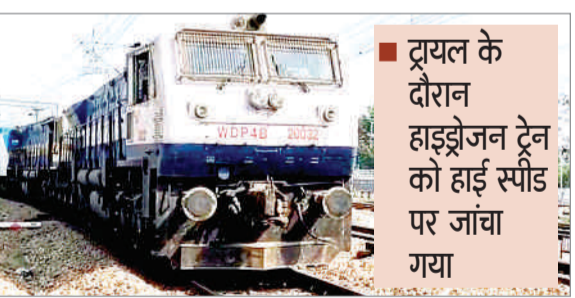
ट्यूल के दौरान हाइड्रोजन ट्रेन को हाई स्पीड पर जांचा गया

एजेंसी नयी दिल्ली : हरियाणा के जींद रेलवे जंक्शन से हाइड्रोजन ट्रेन को शुक्रवार को हाई-स्पीड ट्यूल के लिए दो डीजल इंजनों के साथ दिल्ली रवाना किया गया। जींद से दिल्ली तक ट्रेन की गति 75 किलोमीटर प्रति घंटा रही। इसके बाद दिल्ली-सोनीपत रेलखंड पर विभिन्न चरणों में ट्रेन का परीक्षण किया गया। इस दौरान दिल्ली से सोनीपत रूट पर ट्रेन का ट्यूल 85 किलोमीटर प्रति घंटा की गति से किया गया। वहीं, सोनीपत से दिल्ली जाते समय भी ट्रेन की गति 85 किलोमीटर