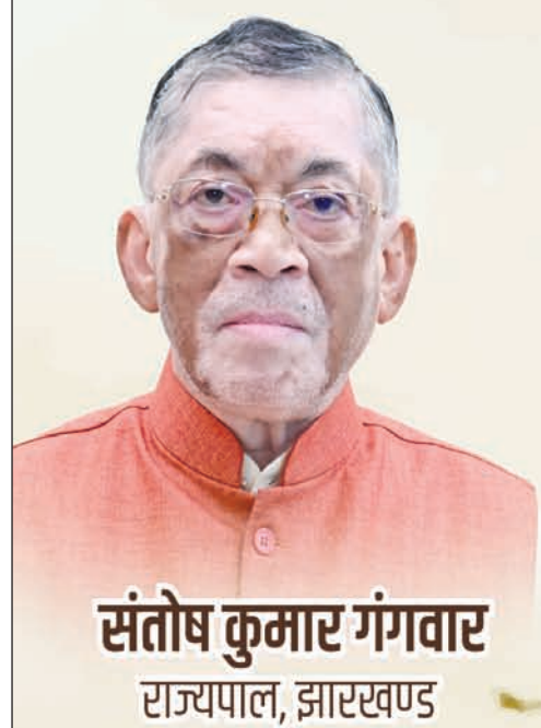
संतोष कुमार गंगवार राज्यपाल, झारखण्ड