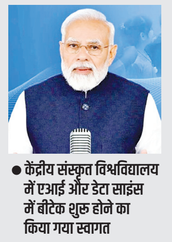
● केंद्रीय संस्कृत विश्वविद्यालय में एआई और डेटा साइंस में बीटक शुरू होने का किया गया स्वागत

प्रधानमंत्री नरेंद्र मोदी ने रविवार सुबह 11 बजे अपने लोकप्रिय मासिक रेंडियो कार्यक्रम 'मन की बात' के 135वें एपिसोड के माध्यम से देशवासियों और युवाओं को संबोधित किया। इस दौरान प्रधानमंत्री मोदी ने नालंदा विश्वविद्यालय और राष्ट्रीय राजधानी दिल्ली स्थित केंद्रीय संस्कृत विश्वविद्यालय का भी जिक्र किया प्रधानमंत्री मोदी ने कहा कि नालंदा विश्वविद्यालय ने शास्त्रार्थ की हमारी प्राचीन परंपरा को फिर से जीवंत किया है। शास्त्रार्थ केवल अपनी बात रखने का माध्यम नहीं है। ये वाद-संवाद और मंथन की एक अनुशासित प्रक्रिया है। इसमें तर्क के साथ, तथ्य के साथ, अपनी बात कहना बहुत जरूरी होता है और उसमें आपकी महारत होनी चाहिए। उन्होंने कहा कि दूसरों के विचारों को धैर्य से सुनने और समझने की सीख भी इस शास्त्रार्थ की प्रक्रिया से मिलती है। मुझे खुशी है कि नालंदा विश्वविद्यालय ने इसे अपने दीक्षांत समारोह का हिस्सा बनाया इससे पहले 19 जून 2024 को भी बिहार के राजगीर में नालंदा विश्वविद्यालय के नए परिसर के उद्घाटन के अवसर पर प्रधानमंत्री ने कहा था कि नालंदा केवल एक नाम नहीं है, यह एक पहचान है, एक सम्मान है। नालंदा मूल है और मंत्र भी है। नालंदा इस सत्य का उद्घोष है कि ज्ञान नष्ट नहीं हो सकता, भले ही पुस्तकें आग में जल जाएं। उन्होंने इस बात पर बल दिया कि नवीन नालंदा विश्वविद्यालय की स्थापना भारत के स्वर्ण युग का शुभारंभ करेगी। प्रधानमंत्री मोदी ने कहा था कि नालंदा के प्राचीन अवशेषों के निकट इसका पुनरुद्धार विश्व