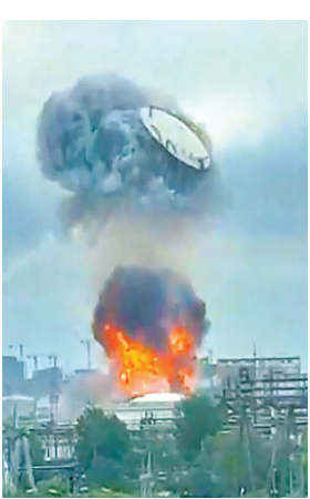
रूस की युद्ध मशीन को चलाने वाली सुविधाओं के खिलाफ हमारे

मॉस्को में एक ऑयल रिफाइनरी को यूक्रेन द्वारा इस हफ्ते दूसरी बार निशाना बनाए जाने के बाद वहाँ से काला धुआँ और आग की लपटें उठने लगीं। सोशल मीडिया पर हमले के वीडियो वायरल होने के बाद, यूक्रेन के राष्ट्रपति वोलोदिमिर जेलेंस्की ने कहा कि यह हमला कीव पर हाल ही में रूस द्वारा किए गए हमलों का उचित जवाब था। जेलेंस्की ने एक्स पर कहा कि यह हमारे शहरों और समुदायों पर रूस के हमलों का पूरी तरह से उचित जवाब है और