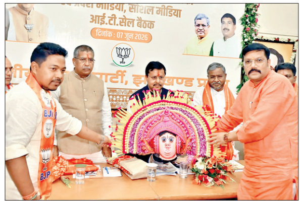
भाजपा के राष्ट्रीय अध्यक्ष को छऊ नृत्य का मुखौटा सौंपकर राज्य की सांस्कृतिक विरासत की जानकारी देते भाजपा नेता।