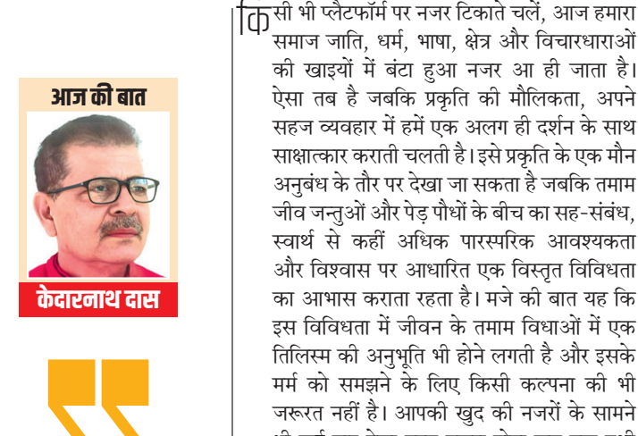
आज की बात