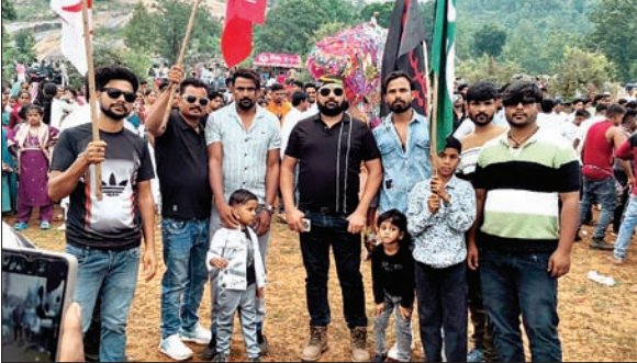
ताजियों का निर्माण किया गया था। रंग-बिरंगी सजावट, बारीक नक्काशी और पारंपरिक शिल्पकला से सजे ताजियों ने सभी का ध्यान अपनी ओर आकर्षित किया। ताजियों के दीदार के लिए दूर-दराज के गांवों से भी लोग पहुंचे और कलाकारों की मेहनत व कारीगरी की जमकर सराहना की। मेले में बच्चों और महिलाओं की भी अवरटोली की मोहर्रम कमेटीयों की ओर से आकर्षक एवं कलात्मक

चैनपुर। प्रखंड के सिल्फरी बेंगटी पहाड़ के समीप शुक्रवार को मोहर्रम का पर्व पूरी अकीदत, भाईचारे और शांतिपूर्ण वातावरण में मनाया गया। इस अवसर पर क्षेत्र में आस्था और सामाजिक सौहार्द का अद्भुत संगम देखने को मिला। विभिन्न गांवों से बड़ी संख्या में अकीदतमंद और आमजन आयोजन स्थल पहुंचे, जिससे पूरे क्षेत्र में मेले जैसा उत्साहपूर्ण माहौल बना रहा। मोहर्रम के अवसर पर बरवेनगर, लंगड़ामोड़, चैनपुर, जमगाई और अवरटोली की मोहर्रम कमेटीयों की ओर से आकर्षक एवं कलात्मक