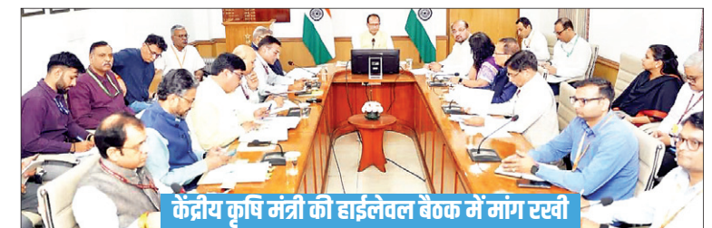
केंद्रीय कृषि मंत्री की हाईलेवल बैठक में मांग रखी