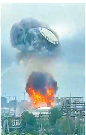
रूस की युद्ध मशीन को चलाने वाली सुविधाओं के खिलाफ हमारे

मॉस्को में एक ऑयल रिफाइनरी को यूक्रेन द्वारा इस हफ्ते दूसरी बार निशाना बनाए जाने के बाद वहाँ से काला धुआँ और आग की लपटें उठने लगीं। सोशल मीडिया पर हमले के वीडियो वायरल होने के बाद, यूक्रेन के राष्ट्रपति वोलोदिमिर जेलेंस्की ने कहा कि यह हमला कीव पर हाल ही में रूस द्वारा किए गए हमलों का उचित जवाब था। जेलेंस्की ने एक्स पर कहा कि यह हमारे शहरों और समुदायों पर रूस के हमलों का पूरी तरह से उचित जवाब है और