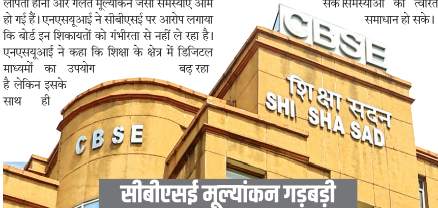
सीबीएसई मूल्यांकन गड़बड़ी

मजबूत सुरक्षा व्यवस्था और बैकअप प्लान भी जरूरी है। याचिका में मांग की गई है कि सीबीएसई को तुरंत एक शिकायत निवारण तंत्र विकसित करना चाहिए ताकि छात्रों की समस्याओं का त्वरित समाधान हो सके। समस्याओं का त्वरित समाधान हो सके।