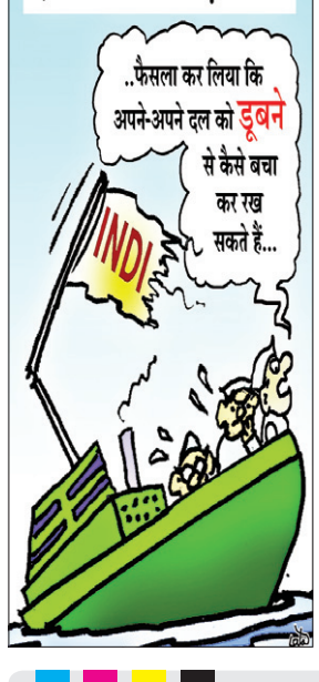
आज / कल इंडिया गठबंधन का बड़ा फैसला

नवीन मेल डेस्क रांची। राज्य के अधिवक्ताओं को स्वास्थ्य बीमा योजना का लाभ उपलब्ध कराने की मांग को लेकर दायर जनहित याचिका पर सोमवार को झारखंड हाईकोर्ट में सुनवाई हुई। सुनवाई के दौरान राज्य सरकार ने अदालत को बताया कि अधिवक्ताओं के लिए स्वास्थ्य बीमा योजना लागू कर दी गई है और इस संबंध में सरकार द्वारा संकल्प (रेजोल्यूशन) भी जारी किया जा चुका है। सरकार इस पक्ष को रिकॉर्ड पर लेते हुए हाईकोर्ट ने कहा कि यदि उक्त संकल्प की गजट अधिसूचना अब तक प्रकाशित नहीं हुई है, तो उसे शीघ्र जारी किया