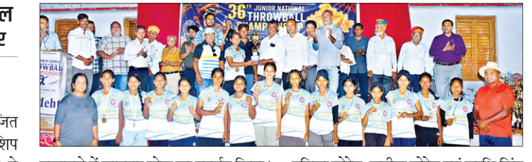
नवीन मेल संवाददाता

● सेमीफाइनल में शानदार खेल के बावजूद कर्नाटक से मिली हार