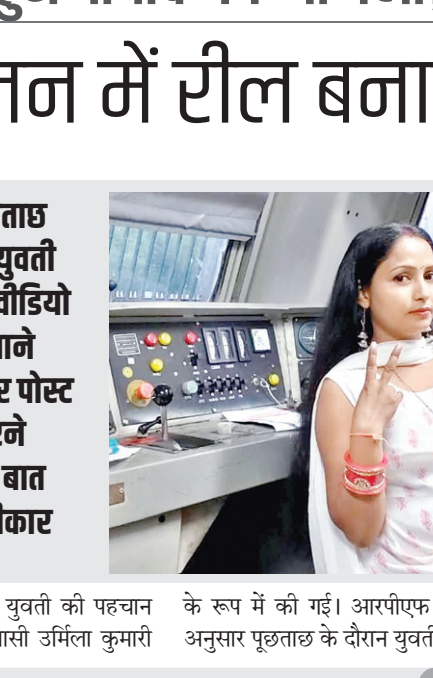
पूछताछ में युवती ने वीडियो बनाने और पोस्ट करने की बात स्वीकार की