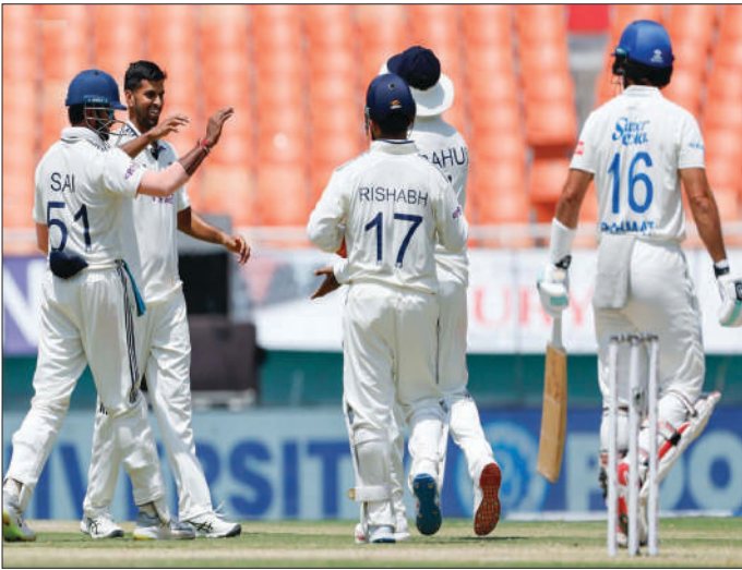
कृष्णा ने 3 जबकि वाशिंगटन सुंदर ने 1 विकेट लिया।