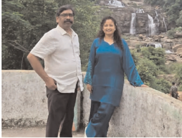
आसपास के लोगों से बातचीत भी की। मुख्यमंत्री ने अपने संदेश में कहा कि जोन्हा फॉल की निर्मल जलधारा,