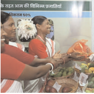
रांची में मेले का भ्रमण कर किसानों का उत्साहवर्धन किया और विभिन्न विभागीय एवं निजी स्टॉलों का निरीक्षण कर कृषि, पशुपालन और