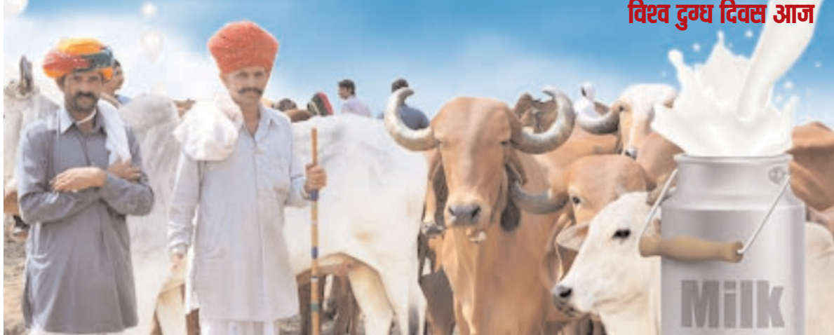
विश्व दुग्ध दिवस आज