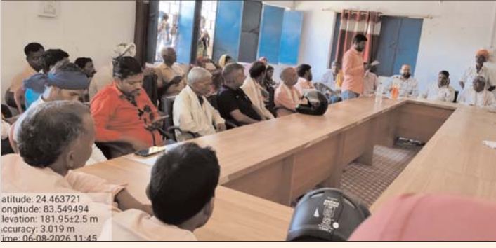
altitude: 24.463721 longitude: 83.549494 latitude: 181.95422.5 m accuracy: 3.019 m time: 06-08-2026 11:45